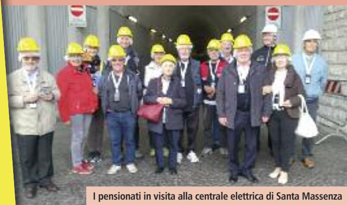
I pensionati in visita alla centrale elettrica di Santa Massenza