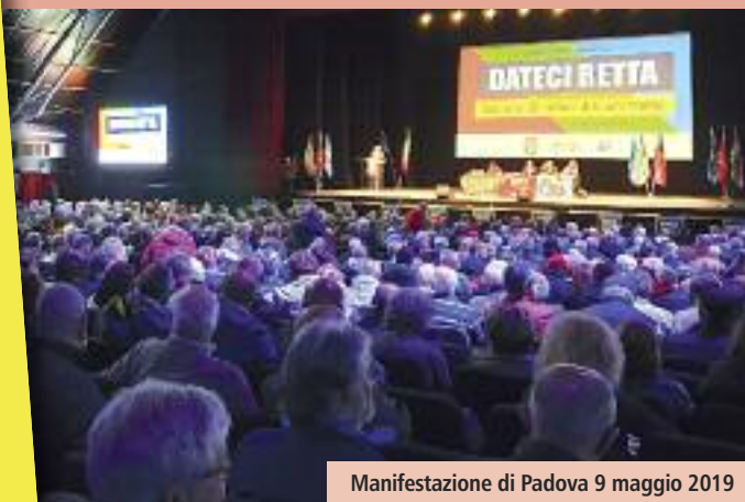
Manifestazione di Padova 9 maggio 2019