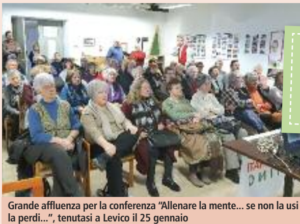
Grande affluenza per la conferenza "Allenare la mente... se non la usi la perdi...", tenutasi a Levico il 25 gennaio

Per presentare la piattaforma con le richieste dei pensionati al Governo (vedi pag. 9) abbiamo indetto a Cavalese, Pergine Valsugana e Borgo Valsugana tre assemblee unitarie FNP, SPI e UILP, abbiamo partecipato con i pensionati alla manifestazione di Padova il 9 maggio (vedi pag. 9) e a Roma il 1° giugno . Possiamo dire di essere soddisfatti per le iniziative proposte in questa seconda parte della stagione, attività che è stato molto apprezzato dai numerosi partecipanti. È proseguita la collaborazione con la Segreteria Regionale,